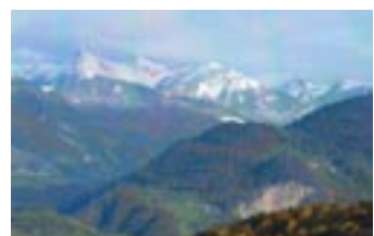
2 photos en automne - le village de Reyvroz - les montagnes des alentours