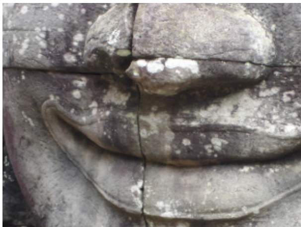
La joie intérieure (Angkor)

« Mes Maîtres ne m'ont pas seulement enseigné des techniques. Ils m'ont aidé à comprendre ce qui se trouve au-delà des techniques et de l'art : la Vie. Ils m'ont montré une Voie : celle de la communication avec tous les vivants, celle de l'intégration consciente dans cet immense élan de joie qu'est la Voie de la Vie... »